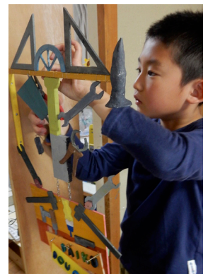
針金でしっかりと 組み合わせて完成！