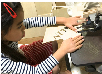
板を糸のこで切りとり