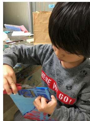
くさりをつけるための ヒートンを付けて