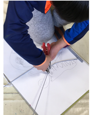
デザインにあわせて 鉄の丸棒を曲げていきます