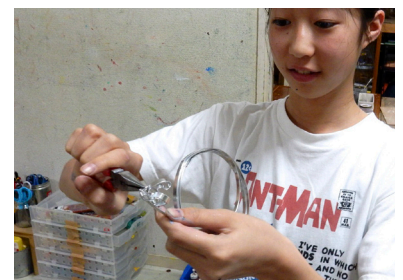
アルミの針金を曲げたり