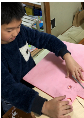
発砲スチロールを 切ったりします